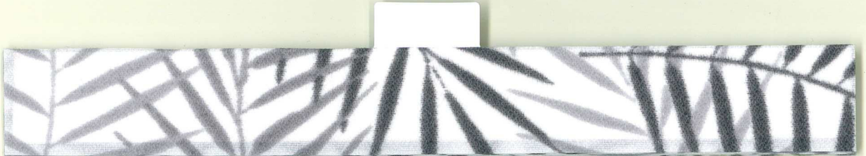
white / grey 5023