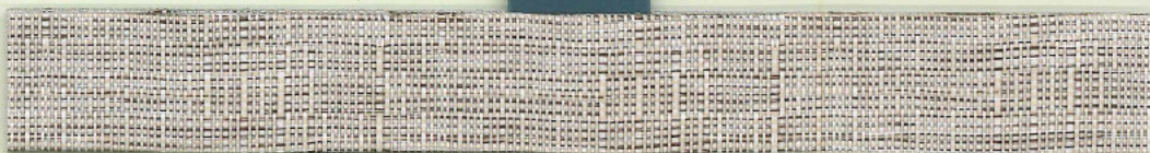
Blended white 26640